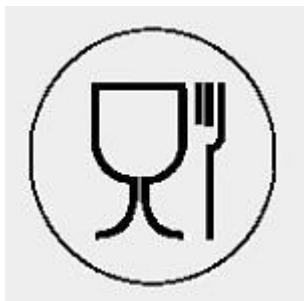
Imagen 1. productos alimenticios