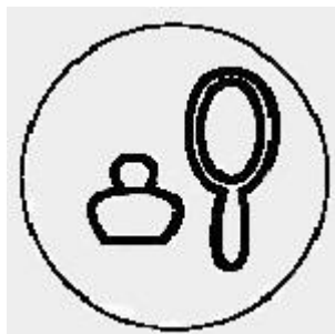
Imagen 2. productos cosméticos y perfumes