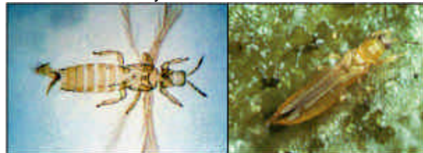
Adultos de T. palmi

Son amarillo pálido a anaranjado con setas oscuras, miden aprox. 1.3 mm de largo. El macho es más delgado y más claro. Se alimentan en sectores de crecimiento nuevo en hojas jóvenes. Las hembras viven 10 a 30 días y los machos 20 días.