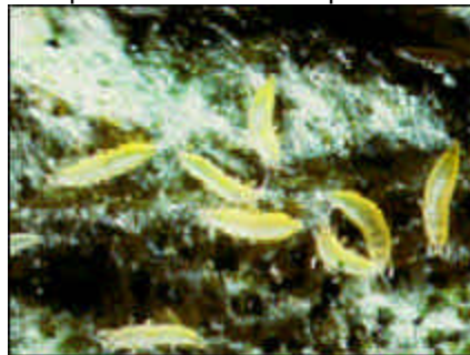
Estadios larvales de T. palmi

Las larvas se alimentan en grupos en zonas cercanas a las nervaduras de hojas más viejas. Requiere de 4 a 15 días para completar su desarrollo dependiendo de la temperatura.