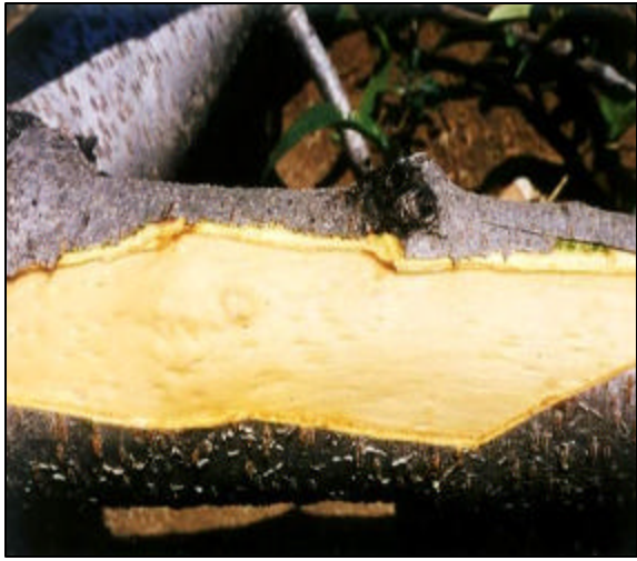
Fig. N° 2: Hendiduras en la madera causadas por el PLMVd