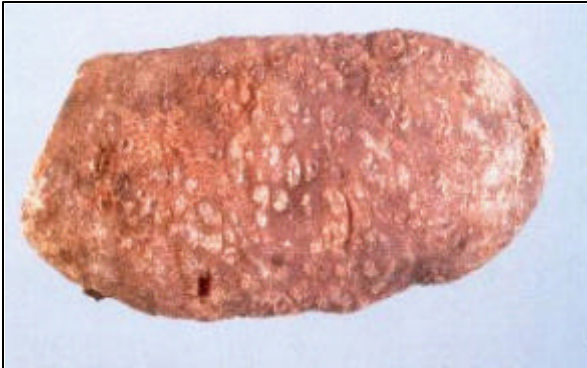
Foto 1. Síntomas de agallamiento severo en tubérculo de papa producido por M.chitwoodi

Partes subterráneas: Raíces y tubérculos con agallas. Las agallas producidas en los tubérculos y causadas por M.chitwoodi se diferencian de otras agallas causadas por otras especies de Meloidogyne . En M. hapla , por ejemplo, son pequeñas pero muy notorias, mientras que en M. incognita las agallas son de formas grandes y fácilmente distinguibles. Los síntomas causados por M.chitwoodi en algunos cultivares de papa, a menudo no son fácilmente notorios ni aparentes y esto difiere según los cultivares. Algunas veces los tubérculos pueden estar severamente infestados sin tener síntomas visibles. Debajo de la agalla, el tejido interno es de color pardo y necrótico, y las hembras son visibles justo debajo de la piel, brillantes, de color blanco, con forma de pera y rodeadas de una capa de color pardo de tejido del hospedero. En las raíces en general las agallas son insignificantes o no existen aún cuando se trate de infecciones severas.